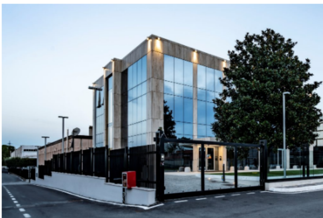
Francesconi Architectural Light | Progetto dell'illuminazione esterna degli immobili Enav, Roma.

L'illuminazione è stata quindi realizzata mediante l'utilizzo di applique Mok posizionate nella sommità dell'edificio: dotate di led di nuova generazione e abbinata a lenti con fasci molto stretti hanno consentito di ottenere un effetto "lame luminose" sui prospetti ma con livelli di illuminazione importanti anche sugli spazi antistanti: un esempio concreto di luce intelligente che non trascurava la funzione estetica, ma che la integra e la completa.