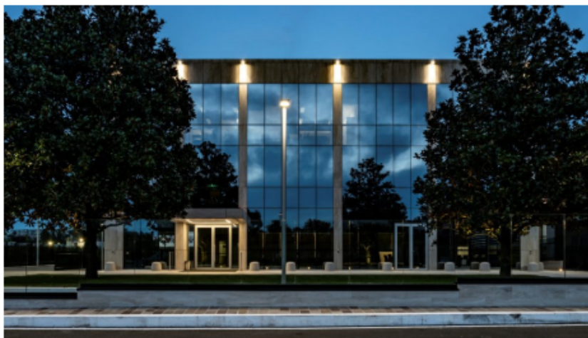
Francesconi Architectural Light | Progetto dell'illuminazione esterna degli immobili Enav, Roma.

Francesconi Architectural Light firma un nuovo importante progetto sul territorio nazionale. Si tratta dell'illuminazione esterna degli immobili Enav di Roma , la società nata nel 1996 come Ente Nazionale di Assistenza al Volo che gestisce il traffico aereo civile in Italia e che intercetta circa 2 milioni di voli l'anno dalle Torri di controllo di 45 aeroporti e dai quattro Centri di Controllo d'Area.